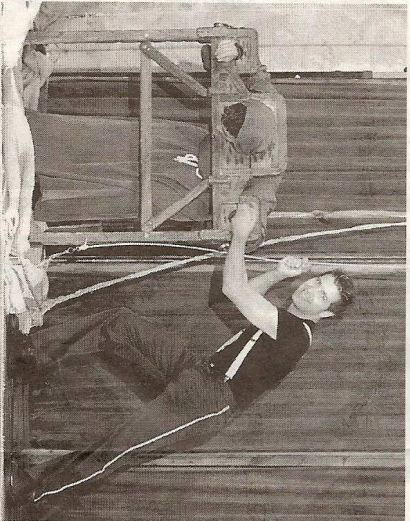
El monje acaba inmovilizado, en el número anterior.